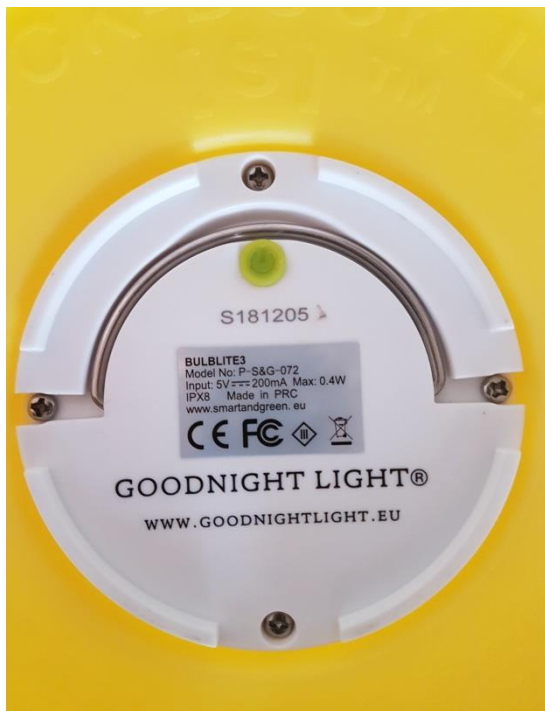
Das Leuchtmodul von unten

Haben Sie beides überprüft und sichergestellt sollte die LED leuchten. Wenn nicht, liegt ein Defekt an der Ladestation vor und sie muss ersetzt werden.